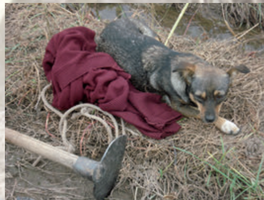
Fig. 9. Se prohíbe al personal ingresar con animales al lugar de producción