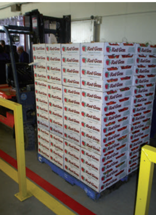
Fig. 6. La fruta no debe estar en contacto sobre el suelo y permanecer sobre pallets.