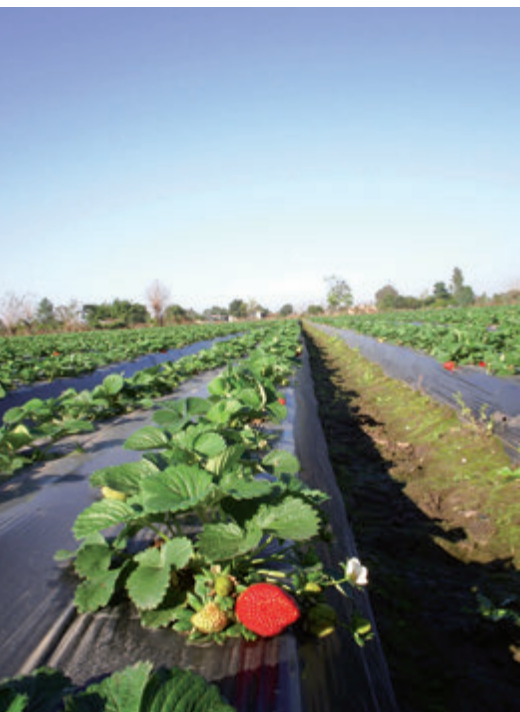
Fig. 1. Camellones (lomos o bordos) para implantar el cultivo, cubiertos con mulch plástico para evitar el contacto del fruto con el suelo y prevenir la proliferación de malezas.

del SENASA/INASE que respalde el cumplimiento de los requisitos sanitarios y de cuarentena.