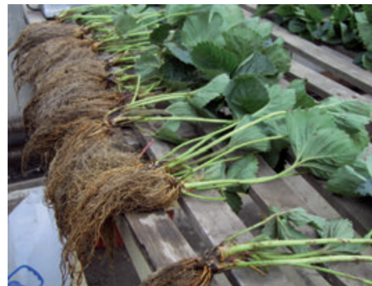
Fig. 2. Plantines sanos, de buena calidad.