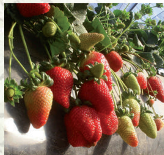
Fig.5. Frutos con diferente grado de maduración.