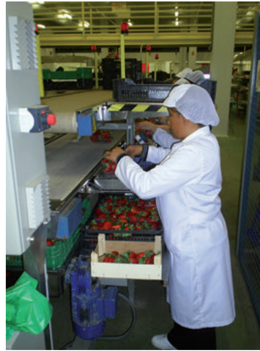
Fig. 8. Personal de embalaje con el atuendo adecuado.