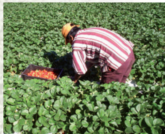
Fig. 4. Cosecha de frutilla.