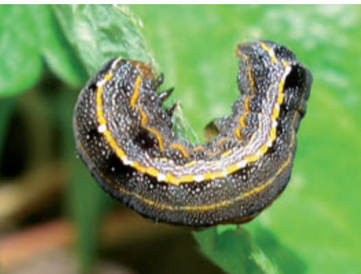
Fig. 3. Oruga cortadora de hojas sobre planta de frutilla.

valor de la producción en riesgo y futura, el tipo de plaga (o enfermedad) presente (Fig. 3), la fase fenológica del cultivo, las condiciones ambientales, y el tipo y densidad poblacional de enemigos naturales presentes.