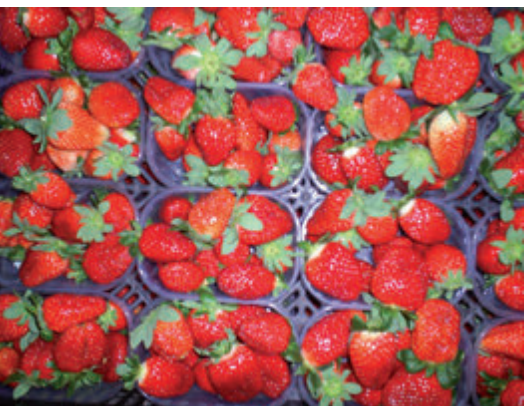
Fig. 7. Preparación de fruta para el mercado fresco.