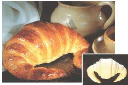
Producto listo para el consumo

También es importante destacar que, dentro de la industria de la panificación, los consumidores valoran la calidad artesanal de este tipo de productos. Las empresas industrializadoras deben tratar de conservar estas cualidades. Como lo revelan diversos estudios de mercado, el pan de molde industrializado no es un sustituto del pan artesanal horneado en las panaderías y para poder llegar a competir con éstas los industriales cuentan en este momento con la tecnología de la ultracongelación que aplicada a las masas posibilita el desarrollo de panes congelados con características sorprendentemente similares a las del pan artesanal recién horneado. Además de la correcta tecnología de congelación, es necesario aplicar durante la elaboración de los panificados ultracongelados técnicas adecuadas que hacen a la obtención del producto deseado y aditivos alimentarios especiales para masas congeladas desarrollados por la ingeniería alimentaria.