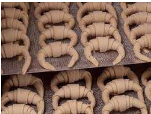
Medialunas en bandejas previo a la ultracongelación

alrededor de 80 Kg por persona por año, mientras que los habitantes del Reino Unido y los irlandeses se encuentran en la parte inferior de la lista con un consumo anual menor a 50 Kg.