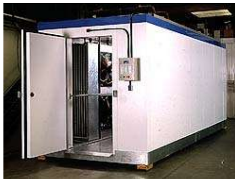
Túnel modular de ultracongelación

Cabe mencionar que, a causa de la crisis económica del año 2001, la inversión en tecnología, en general, se ha visto frenada. Empresas proveedoras de equipos para congelación observan que a partir de fines del año 2004 comenzó a crecer nuevamente la demanda de este tipo de equipos para operación por carros -que son los utilizados por las Pymes- ya que las grandes compañías industrializadoras de panificados cuentan con túneles de ultracongelación (en espiral o lineales continuos) mucho más costosos, adquiridos durante la década del '90.