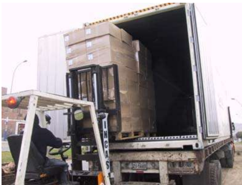
Panificados ultracongelados para exportación

Por otra parte, la tecnología de congelación aplicada a las masas además permite bajar los costos ya que la capacidad de producción se ve aumentada gracias a la optimización de los tiempos; la programación de la producción se realiza de manera más racional y de forma más flexible. Los productos panificados congelados se conservan durante períodos de tiempo que abarcan alrededor de tres meses y ante un incremento de la demanda de un determinado producto puede responderse de manera efectiva y precisa ya que se trabaja con control de stock. Asimismo, resulta la única forma de exportar productos panificados conservando las variedades artesanales propias de cada región.