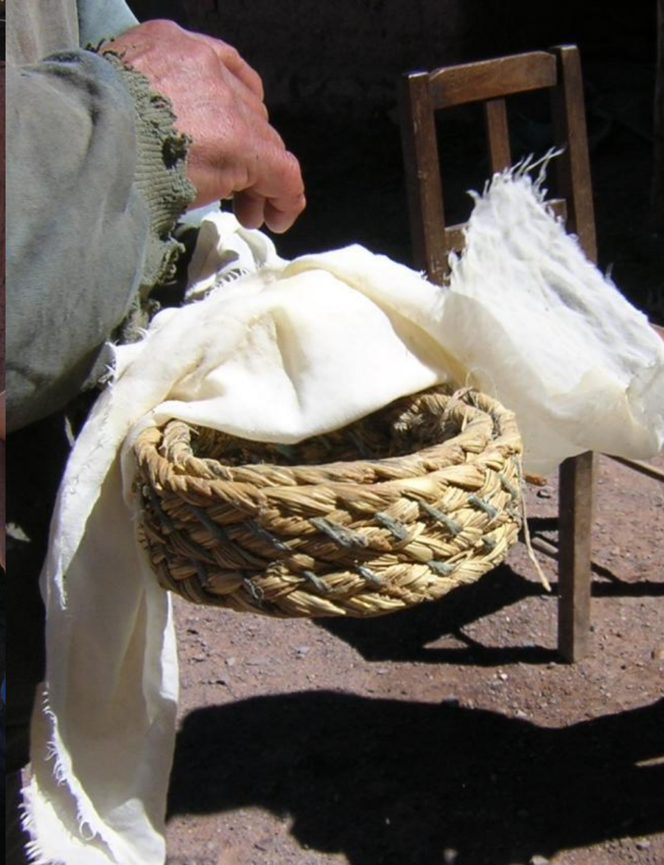
Molde de Cinchón