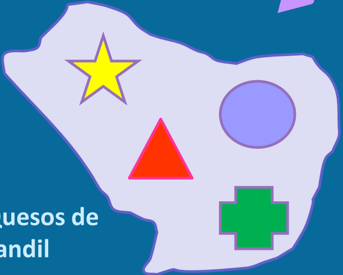
Quesos de Tandil