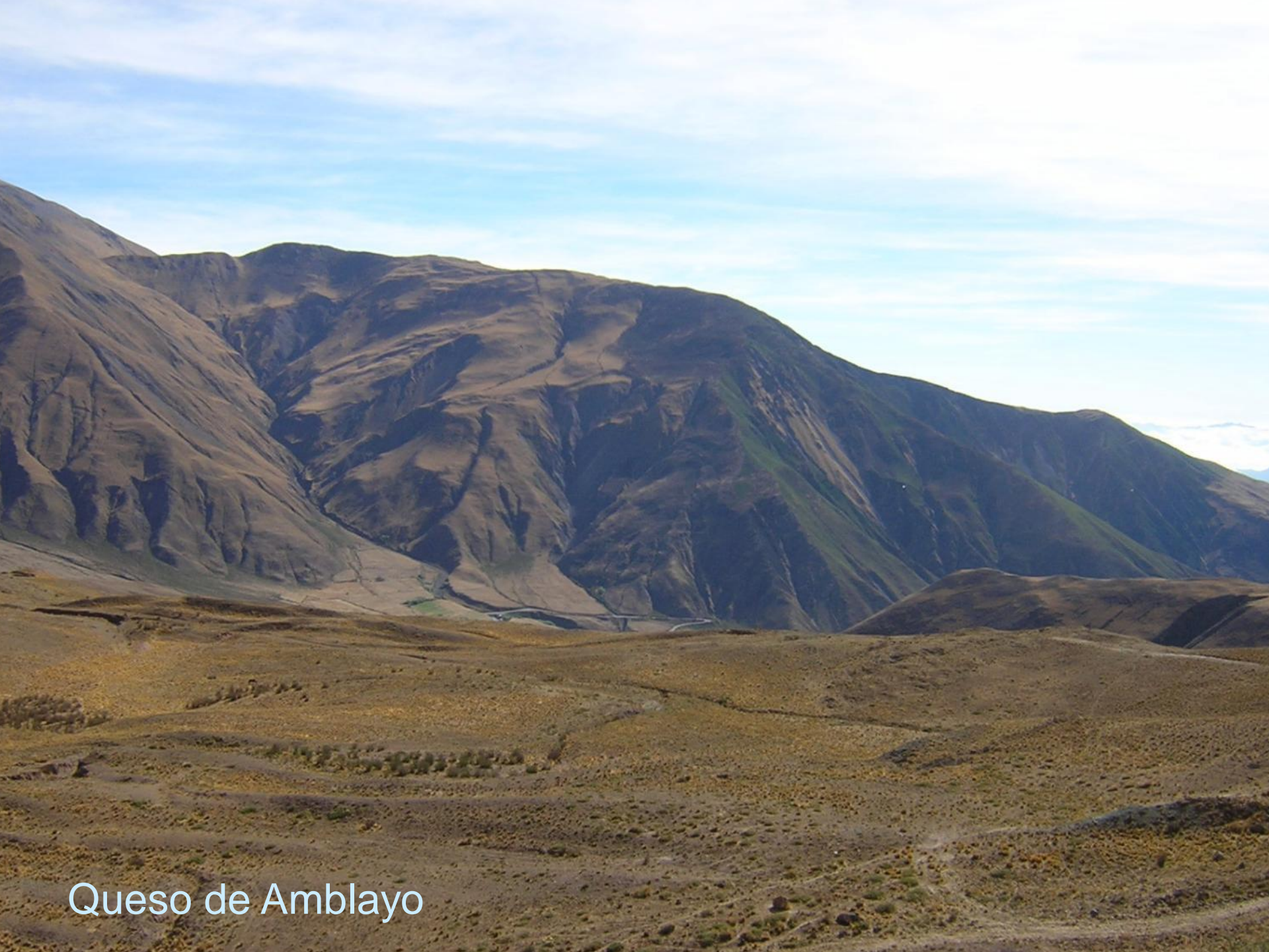
Queso de Amblayo